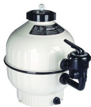
Cantabric tartály - oldal szeleppel