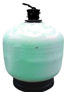
Budapest BW TOP