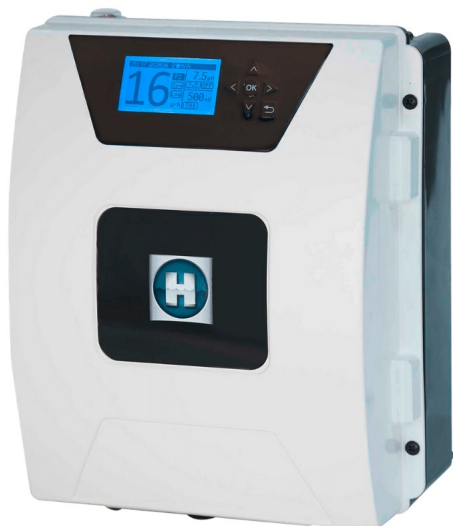
Aquarite Flo sóbontó