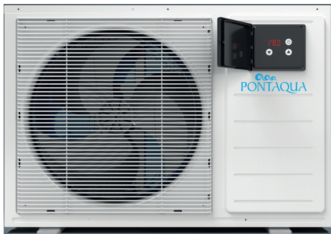
Pontaqua Ecolux hűszivattyú