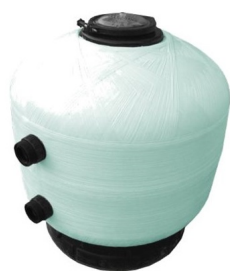
BW Side tartály